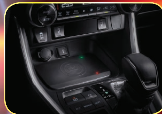
車用無線手機座充