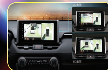
環景影像輔助系統