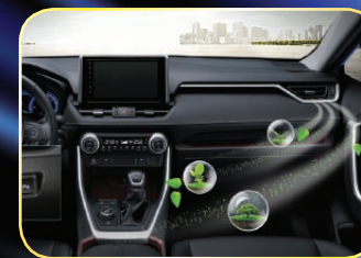
智能負離子清淨機