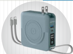
MOZTECH | 萬能充Pro