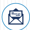
Mail Service 郵件服務