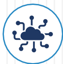
Cloud Service 雲端服務

自由系統是全台第一間資訊託管服務商(Managed Service Provider)，根據客戶公司發展需求，進行客製化的資訊委外規劃，從數位轉型、資訊安全、雲端應用到系統整合維護，皆能為企業全面把關。協助企業省下不必要的風險成本並專注於核心商業目標。